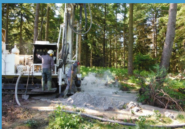
Réalisation de forages de reconnaissance dans le socle granitique jusqu'à 100 m de profondeur.